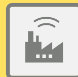
ГУДКИ ПРЕДПРИЯТИЙ И ТРАНСПОРТНЫХ СРЕДСТВ